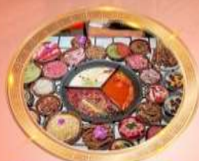
บุฟเฟต์หมีโพงซิ่ง