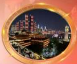
มือทำร้านอาหารวีวอล์กอิน