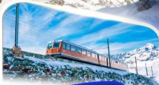
ขบวนรถไฟฟันเฟืองก่อนนอร์แอนด์