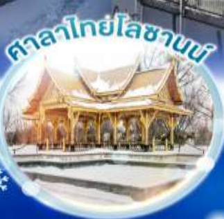
ศาลาไทยโบราณ