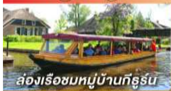
ล่องเรือชมหมู่บ้านกังหัน