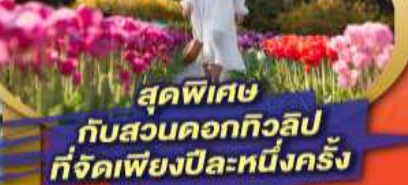
สุดพิเศษ กับสวนดอกทิวลิป ที่จัดเพียงปีละหนึ่งครั้ง