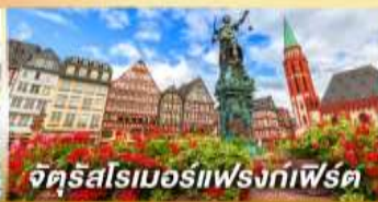
จัตุรัสโรเมอร์ฟรังก์เฟิร์ต