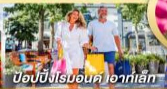
ป๊อปปิงโรมอนด์ ไอทาลี