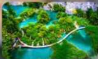
อุทยานแห่งชาติพลีทวิเซ่