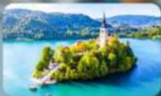
โบสถ์พระแม่มาเรียแห่งบลัด