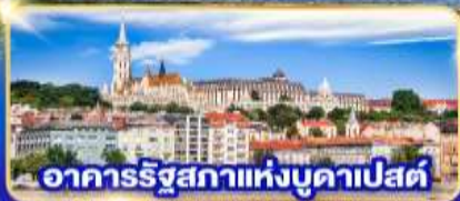
อาคารรัฐสภาแห่งบูดาเปสต์