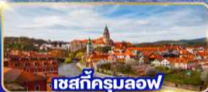
เซสท์ครุมลอฟ