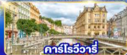
คาร์โรวัวร์