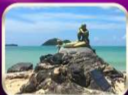
เที่ยวหาดสมิหลา สงขลา