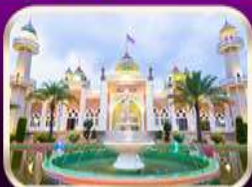
ชมมัสยิดกลางปัตตานี