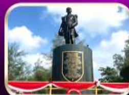
อนุสาวรีย์กรมหลวงชุมพรฯ